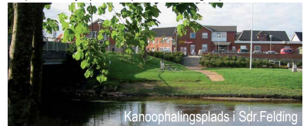
Kanoophalingsplads i Sdr. Felding

Sdr. Felding har ca. 1.500 indb. Byen er opstået og opbygget omkring Skjern Å, der i de senere år er blevet mere synlig i bybilledet, med ny sti, bro og kanoophalingsplads. Byen har bevaret sin ældre bykerne neden for kirken, og tæt ved det gamle vadested over åen. Sdr. Felding var i årene 1917-68 stationsby for Trolldhedebanen. I byen er der dagligvareforretninger, børneinstitution, skole op til 9. klasse, SFO, plejecenter m. ældreboliger, idrætshal, stadion, ridehal, biograf, lægehus, kulturcenter og restauration. På byens virksomheder er der knap 800 arbejdspladser. ( www.sdrfelding.dk )