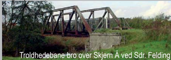
Trolldhedebane bro over Skjern Å ved Sdr. Felding

Parallelt med "Stien på Heden" og "Skovstien & Mosestien" havde Trolldhedebanen sit forløb i 1917-68. Jernbanen havde linjeføring fra Kolding over Grindsted til Trolldhede, i alt 87,9 km. Dengang var det Danmarks længste private jernbane. Banen havde stor betydning for de egne den gemmenløb. Under 2. verdenskrig transporterede banen meget store mængder brunkul, som der bl.a. blev gravet meget af i området omkring Stakroge/Sandet. I perioder var driftsøkonomien meget dårlig for Trolldhedebanen, og banen måtte desværre nedlægges i 1968. I dag er der få spor tilbage af banen, bl.a. broen over Skjern Å ved Sdr. Felding. Der henvises til "Trolldhedebanen" af Helge Kjærside, Finn & Steen Christensen.