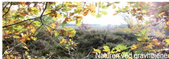
Naturen ved gravhøjene

På egnen omkring Sdr. Omme har der været godt 120 gravhøje, som i dag er reduceret til ca. 60, idet mange gennem tiderne er blevet sløffet og overpløjet. Gravhøjene er fredet i dag. "Stien på Heden" har linjeføring forbi 5 af gravhøjene. Det karakteristiske ved gravhøjene er, at de er små og lave, typisk ligger der 3 høje i en klynge. Gravhøjene er anlagt af "stridsøksefolket", et nomadefolk som kom hertil i slutningen af det 3. årtusinde før Kristi fødsel. Det var et krigerisk folk, der oprindeligt kom fra egnene omkring det kaspiske hav. De afdøde mænd blev lagt til højre i gravene med deres stridsøkser, de afdøde kvinder blev lagt til venstre med bl.a. ravperler. Mændene blev lagt med ansigtet mod syd, verdenshjørnet som de kom fra. Gennem tiderne er gravhøjene blevet eftersøgt af bl.a. gravrøvere, som ledte efter guld. Højene er fra før guldet kom til Danmark, så gravrøverne har ledt forgæves. (Der henvises til Sdr. Omme Egnsarkiv.)