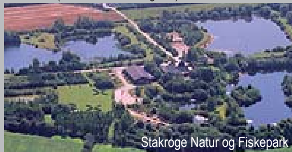
Stakroge Natur og Fiskepark

Området byder på 25 tdl. naturområde, velegnet til udflugter i naturen. Fra solopgang til solnedgang kan der fiskes i fiskesøen, fiskekort købes på stedet. I naturparken findes der grill, bålplads, hus med borde/bænke, god plads til boldspil, spejderaktiviteter m.m. Der må bades i det tilladte område, dog på eget ansvar. Der er mulighed for overnatning (primitivt) i naturparken. Ring og bestil tid (mellem 17.00-18.00) på tlf. 75347173. ( www.sandet-stakroge.dk )