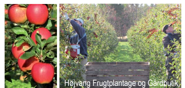
Højvang Frugtplantage og Gårdbutik

Fra "Stien på Heden" er der adgang til Højvang Frugtplantage og Gårdbutik, Skærsigvej 7. I august-november tilbydes selvplok. I denne periode har gårdbutikken åben, hvor bl.a. frugtplantagens æbler, pærer, blommer og bær kan købes. Højvang Frugt leverer firmafrugt til virksomheder i det midt/vejstjyske, samt skolefrugt. ( www.hojvangfrugt.dk )