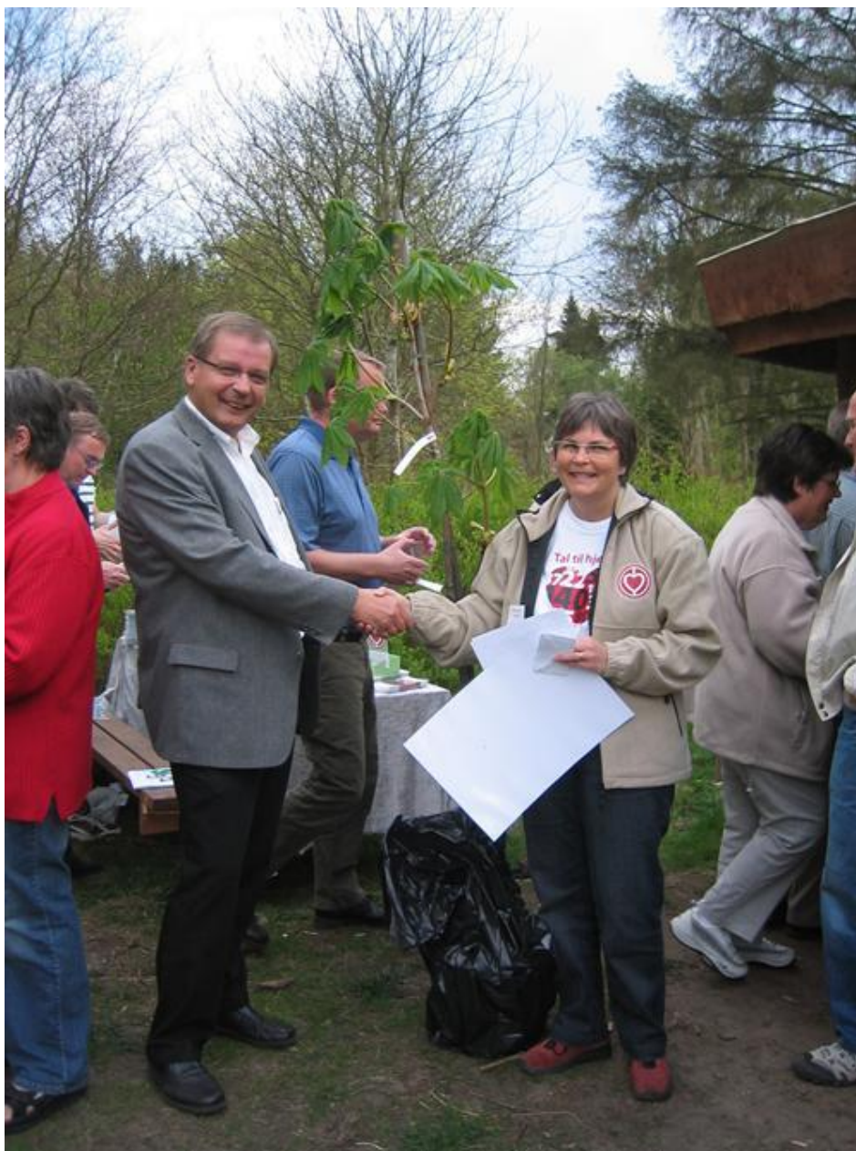
Fra indvielsen af Hjertestien i Sdr. Omme den 23. april 2009.

Kort over hjertestien i Sdr. Omme