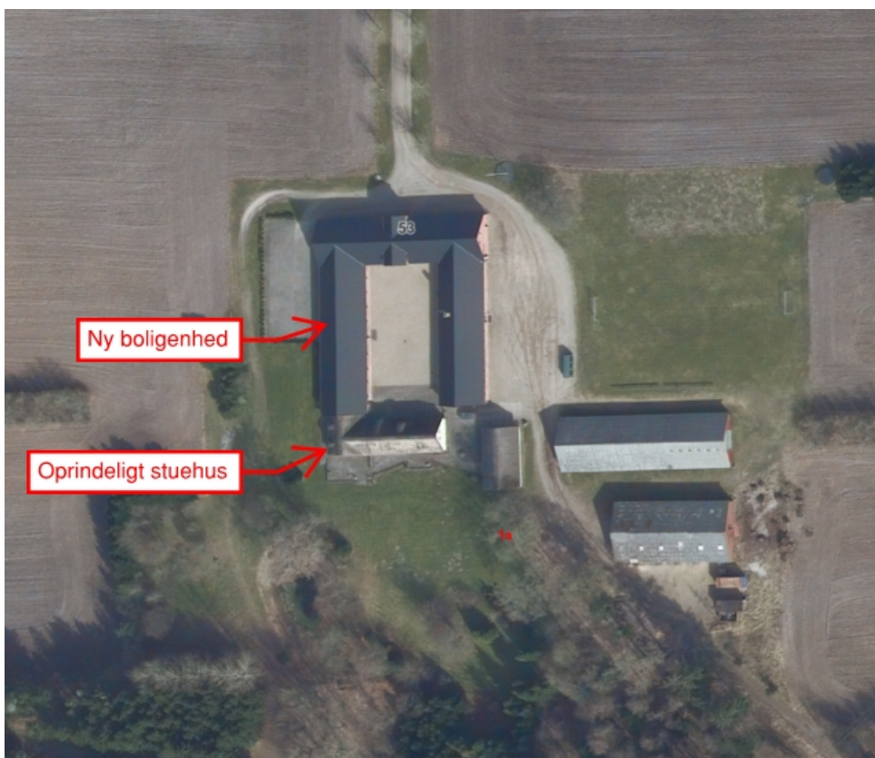
Luffoto af Grindsted Landevej 53, 7200 Grindsted der viser placering af de 2 boligenheder.

Sagsbehandler: Tine B. Rasmussen Tlf. 7972 7062 TBR@billund.dk