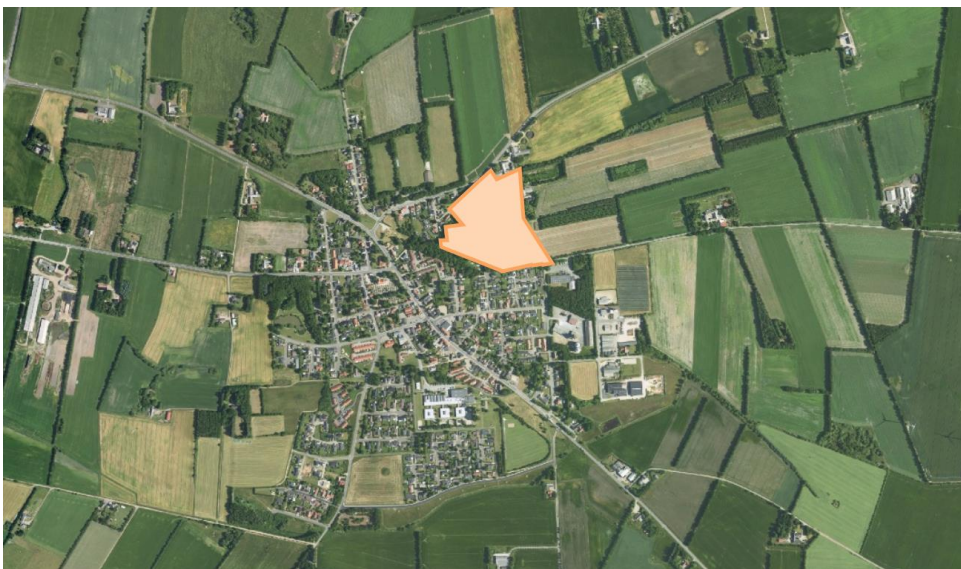
Området ved Østerbo

Sagsbehandler: Louise Grønbech Andersen Tlf. +45 79 72 72 44 LGA@billund.dk