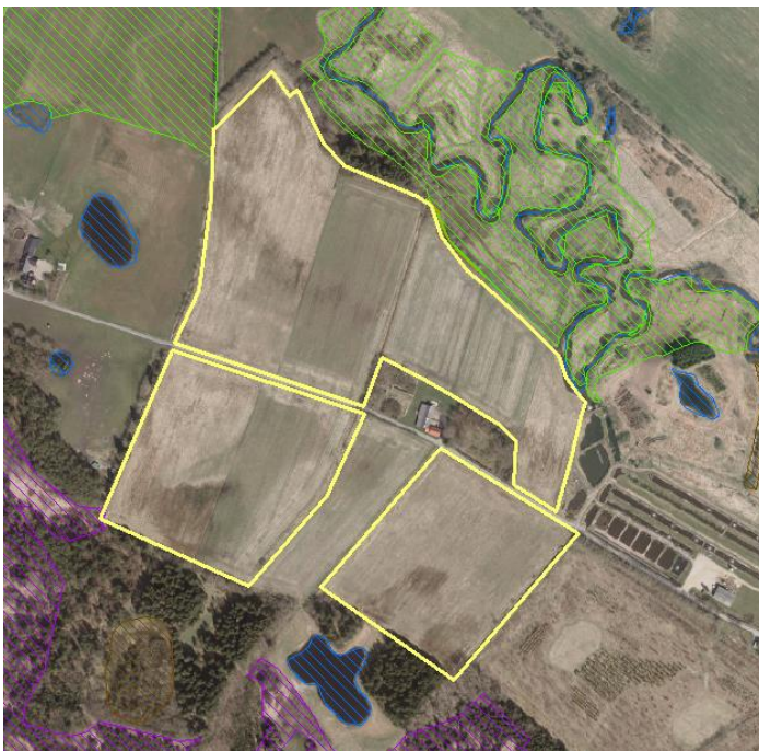
Kort 1: oversigt over projektområdet

Denne tilladelse vil erstatte den tidligere tilladelse givet den 20. maj 2020 "Tilladelse efter planloven, vandløbsloven og naturbeskyttelsesloven til etablering af vådområde". Grunden til at lave en ny tilladelse er, at projektet har ændret sig i forbindelse med udarbejdelsen af detailprojektet.